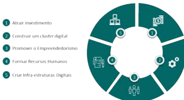
Dimensões Estratégicas do Parque Tecnológico de Cabo Verde

Para implementar efetivamente a Visão e a Missão previamente definidas, a estratégia do Parque Tecnológico de Cabo Verde considera cinco Dimensões Estratégicas que se desdobram em doze objetivos estratégicos.