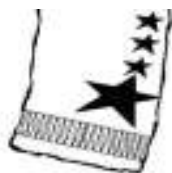
Comandante de Brigada