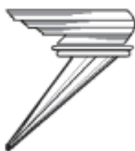
Facho do Oficial Comandante (de metal dourado)