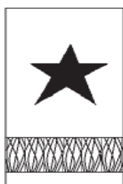
(com a estrela de Oficiais Comandantes)